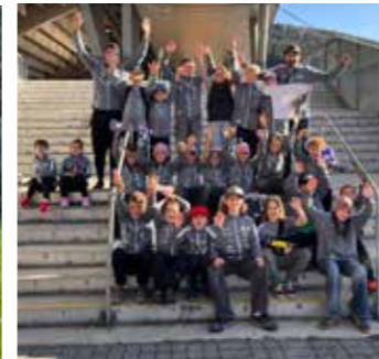
Ausflug zur WSG Tirol